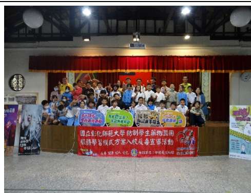
彰化縣鹿港鎮洛津國小反毒話劇 宣導