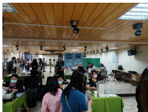
校內教職員工團體檢查