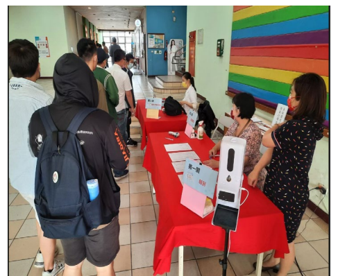
校內公費流感注射