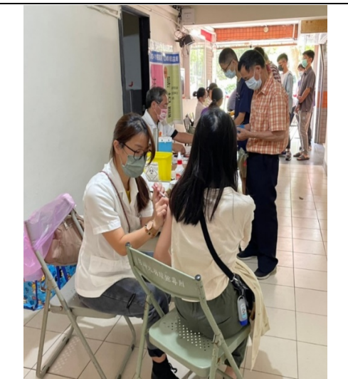
二校區辦理 COVID19 疫苗注射