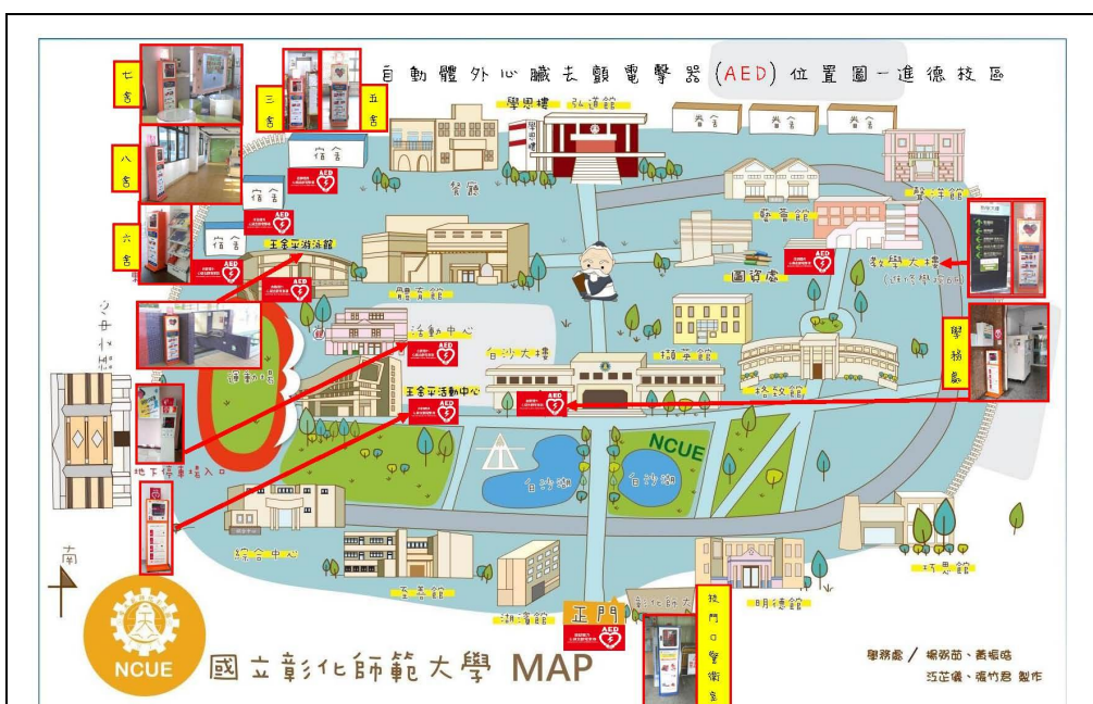
本校進德校區-AED 設置位置圖，共 10 台，提供緊急救護使用，營造安心校園氛圍