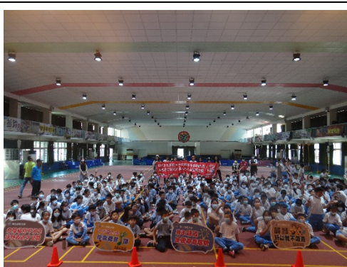
彰化市郭國小反毒話劇宣導