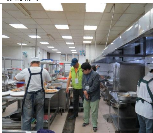
教育部進行餐飲衛生實地輔導