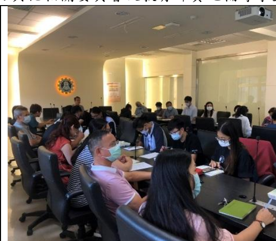
膳食管理委員會開會情形