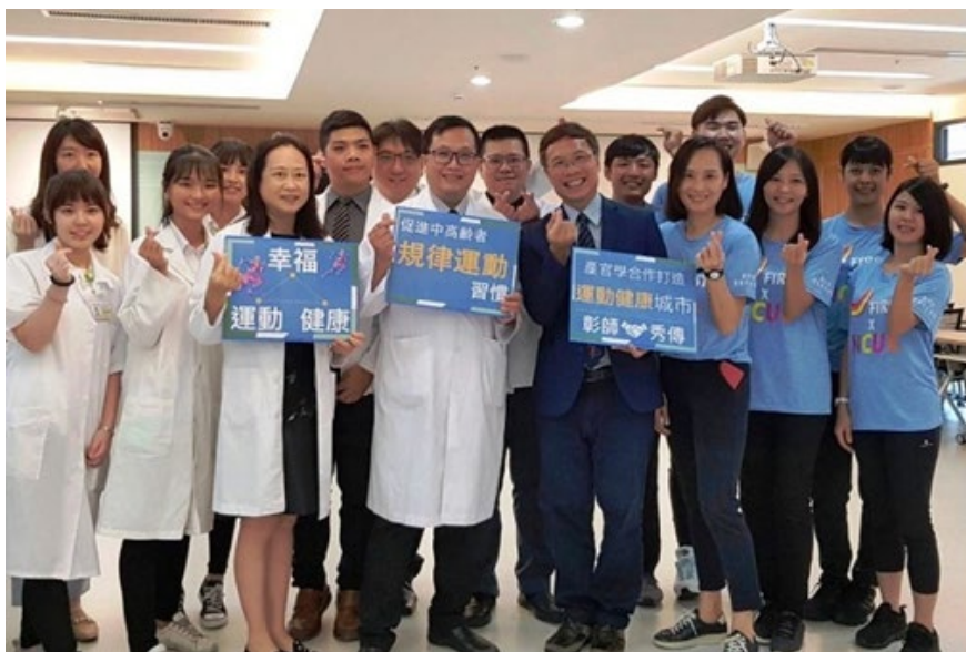
本校與秀傳醫院攜手合作，打造運動健康幸福城市