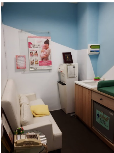
進德校區-溫馨的哺集乳室