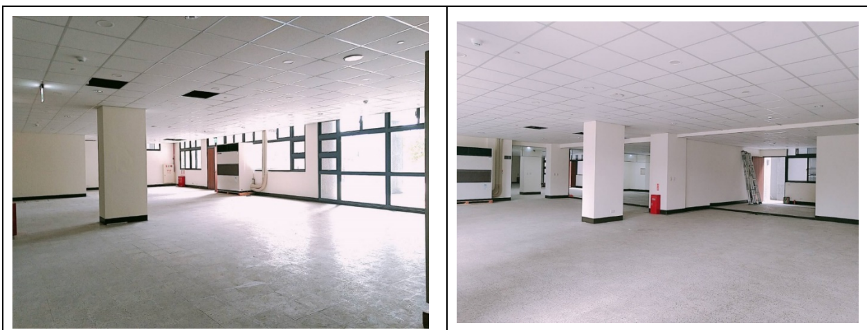
寶山校區美食街(預定場地)