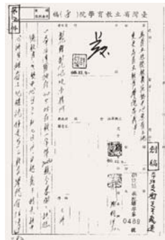
圖 3-3-2：省立進德教育實驗中心原有土地變更為臺灣省立教育學院名義

除了酒廠用地，臺灣省立教育學院進德校區的校舍設備，第二部分來自於進德實驗中學，進德中學期間興建的校舍且沿用於臺灣省立教育學院者為大禮堂、活動中心、游泳池、建白館、科教館、行政大樓、第三、四、五宿舍、眷區教職員宿舍。