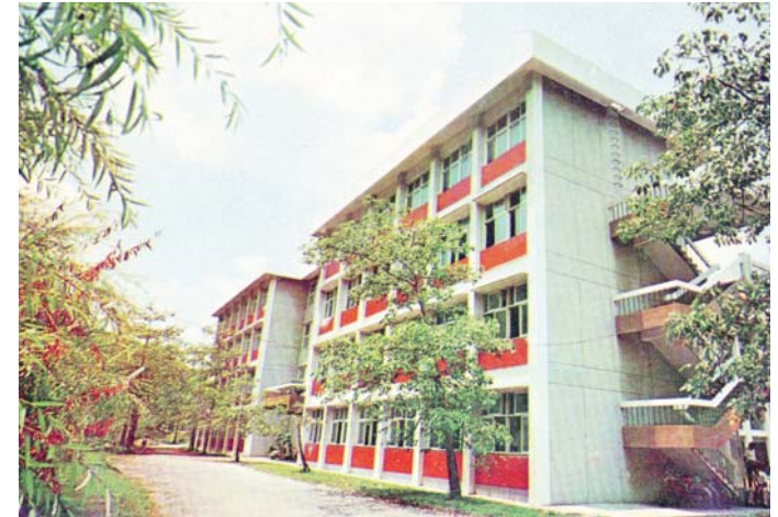
圖 4-3-6：職業教育大樓（今之地理系館／聲洋館）

上談兵。有鑑於此，該系最大的特色就是工業科目綜合測驗與術科測驗，以及專業技術能力測驗，藉此考驗學生的實做技術。其次為專業術科能力測驗，其目的在於培育學生進入社會之後能具備獨當一面的能力，並讓學生了解出題的技巧與分數的分配。第三則是生產技術教育，讓學生了解基層工作單位的現況與運作，同時也能探討生產過程、企業經營與勞資問題。第四為成品設計與製作，這為四年級下學期課程，同學分組為一團隊，一起集思廣益設計出一個作品，從中讓學生進行頭腦思考，並將腦中構思創作為現實產品，並且也體會到資金如何運用採買材料，畢業當天之時，學生發表各組之成品，甚至可作為教具。職是之故，該系雖為培育職業學校工科教師為主，但課程設計不僅僅只是培養工科教師，而是若進入企業、工廠就職，能成為獨當一面的技術人才與主管。 39