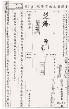
圖 3-3-1：本院建物使用執照三份函請建築地址改正為彰化市和訓里和訓巷 18 號

另一方面，九年義務教育的推動，省辦高中、縣市辦初中的原則確立，民國50年彰化縣彰化初級中學籌備處成立花壇初級中學分部，暫借彰化商業職業學校招收新生，爾後再商借前述閒置的酒廠地上課，這是此地空間首次用於教育。隔年學生遷往八卦山校地上課，即彰化初級中學（今彰化藝術高級中學）。 43 以彰化在地的角度來看，仍期望以經濟需求為導向，因此持續向公賣局爭取酒廠早日進行運作，當時公賣局在經費考量之下，一度傾向改由臺北第二酒廠增產 44 ，最後公賣局以地下水質不佳回應，確定彰化酒廠廠房維持閒置，最後改在臺中烏日設廠。 45 酒廠設施後來成為臺灣省立教育學院的實習工廠、餐廳、第三宿舍。