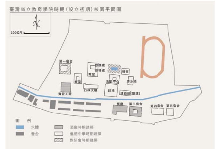
圖 3-3-3：臺灣省立教育學院設立初期校園平面圖

第三部分則來自中等教師研習會時期興建，即臺灣省立教育學院之第一宿舍。以下利用臺灣省立教育學院時期校園平面圖說明：