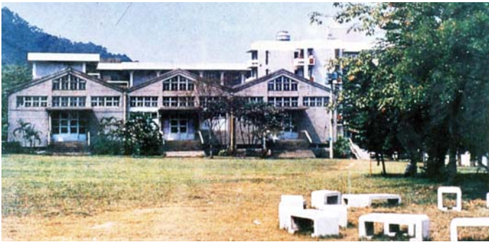
圖 4-3-5：工業教育學系實習工場（今日之美術系館／藝薈館）

該系有實習工場（前身為中興啤酒廠廠房，今日則是藝薈館／美術系館），而且又是培養職業學校工科教師，因此不能空有理論知識，而沒有技術經驗，學生不能紙