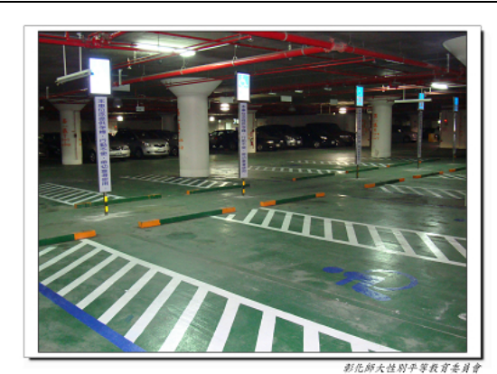
彰化師範大學性別平等教育委員會