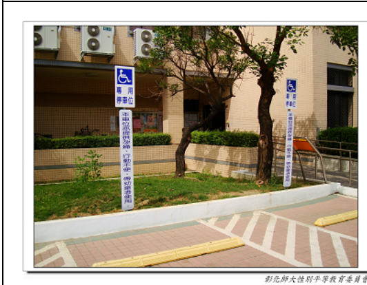
彰化師範大學性別平等教育委員會