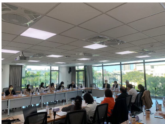
「110 年度大專校院防疫整備及學生宿舍 實地訪視」