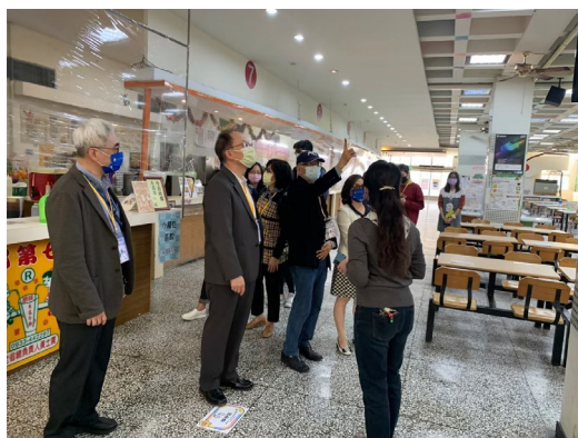
訪視委員審視本校餐廳各項創新的防 疫措施