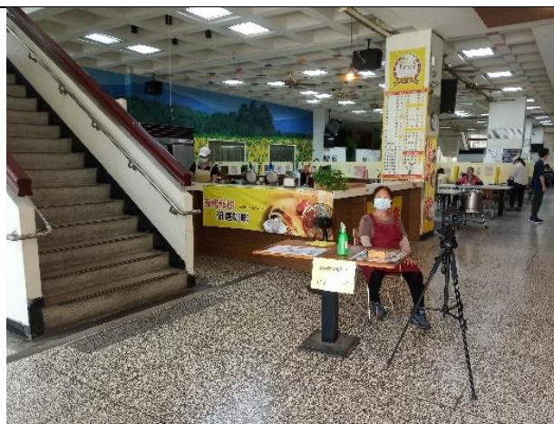
使用熱像儀監測入內人員體溫