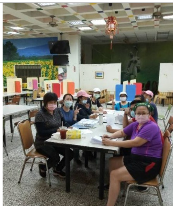
學餐工作人員防疫工作說明