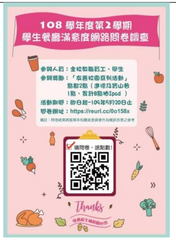
學餐滿意度調查海報