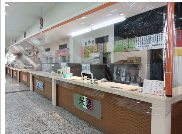
本校學校餐廳防疫環境建置-1. 販賣區 設置攤位隔屏