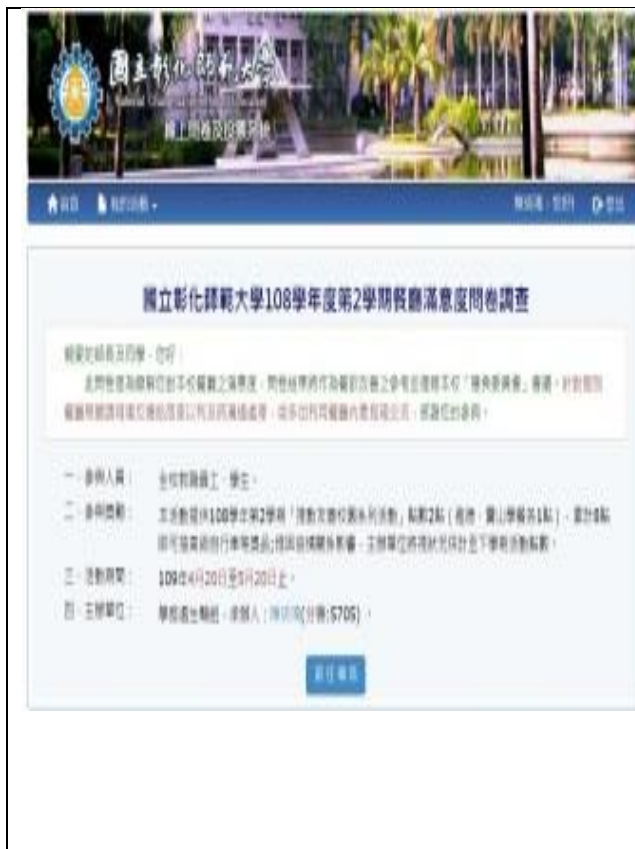
學餐滿意度調查網頁