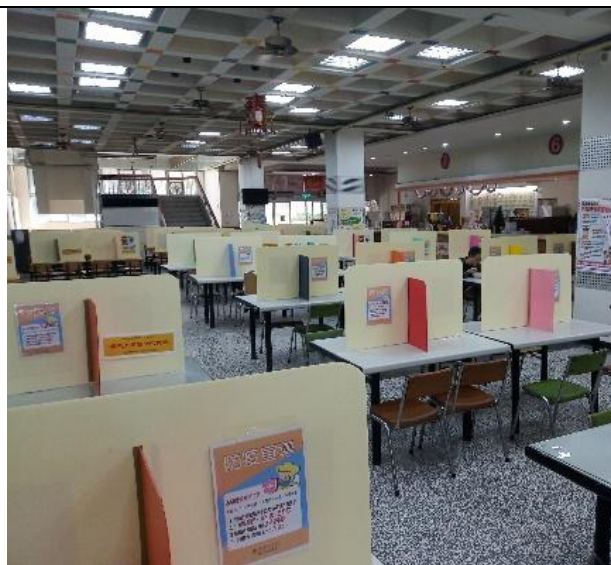
本校學校餐廳防疫環境建置-2. 座位區 設置用餐隔板