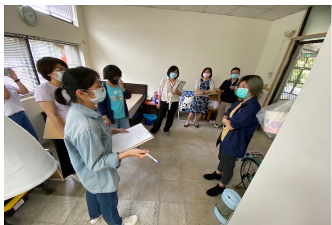
圖說：雲林科大特殊教育到校訪視輔導