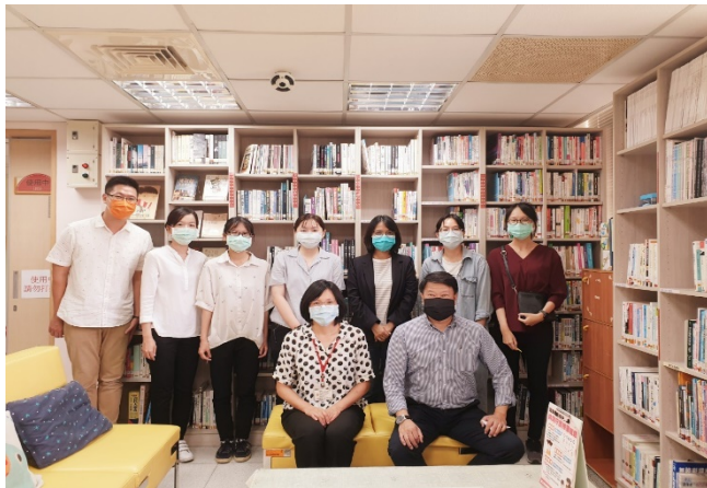
圖說：大葉大學特殊教育到校訪視輔導