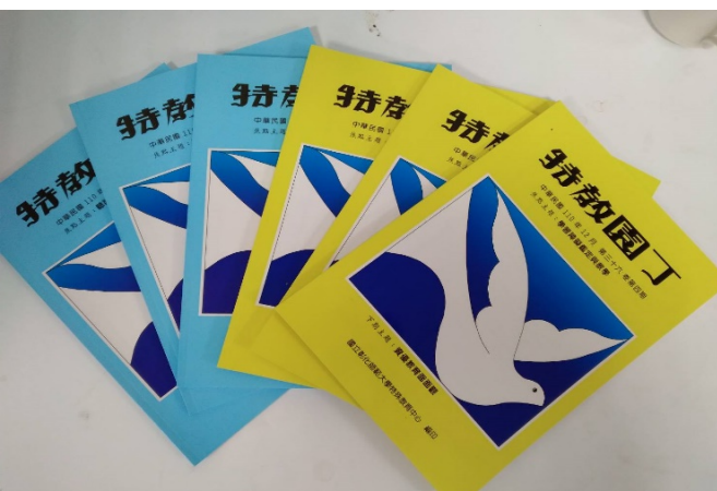
圖說：2021 年出版之特教園丁