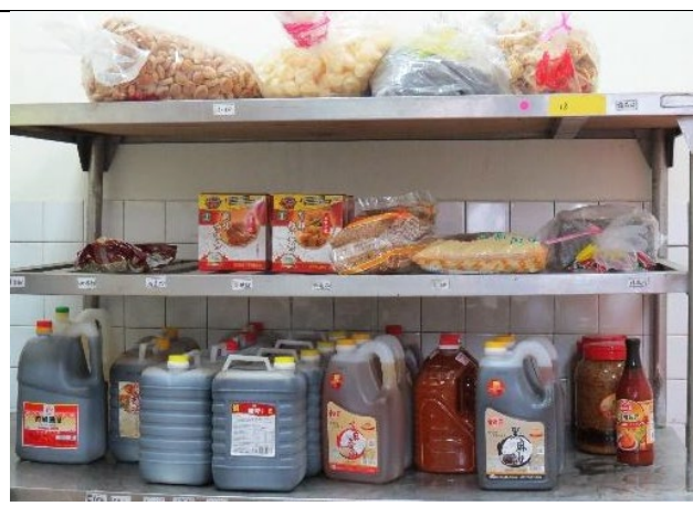
選用 TAP、CAS 優良產品