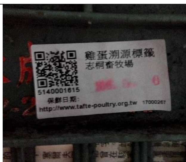
使用當地食材-雞蛋