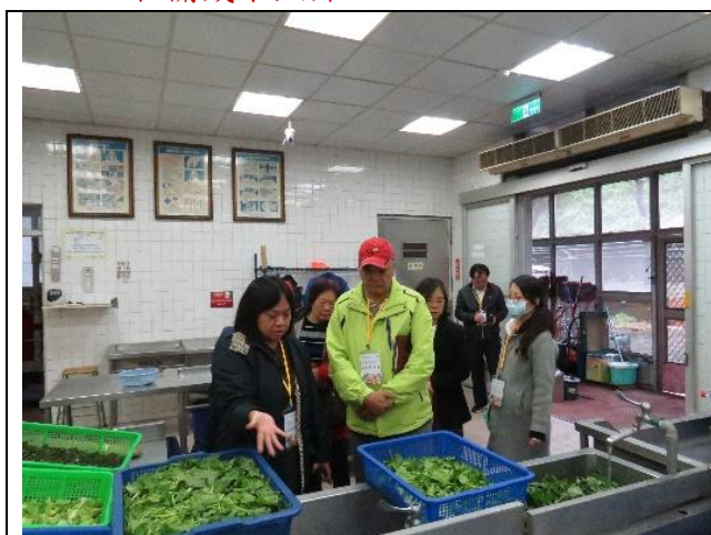
教育部每學年餐飲衛生實地輔導