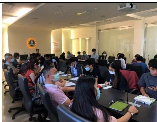
膳食管理委員會開會情形