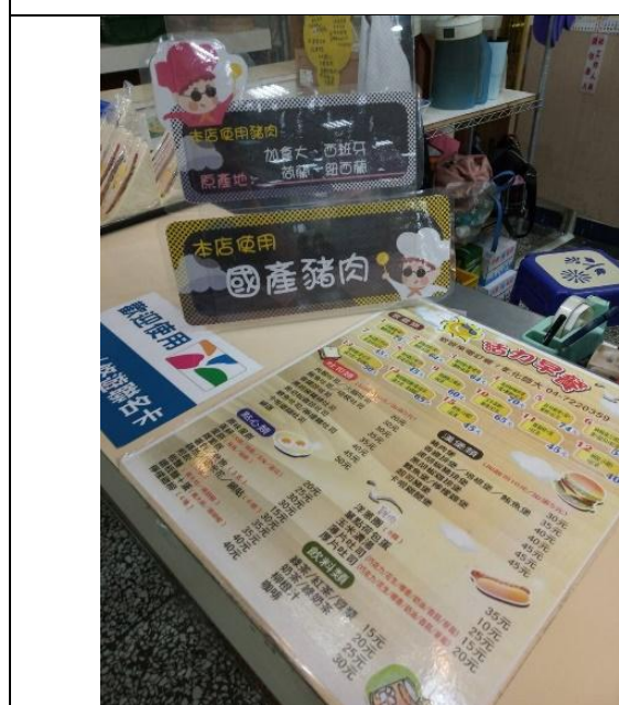
食材來源管理-肉品來源