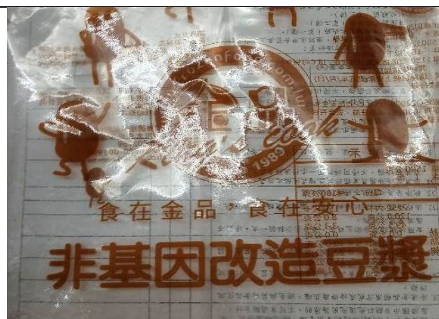
食材來源管理-非基改食品