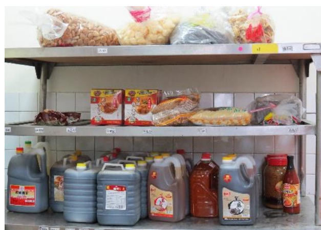
選用 TAP、CAS 優良產品