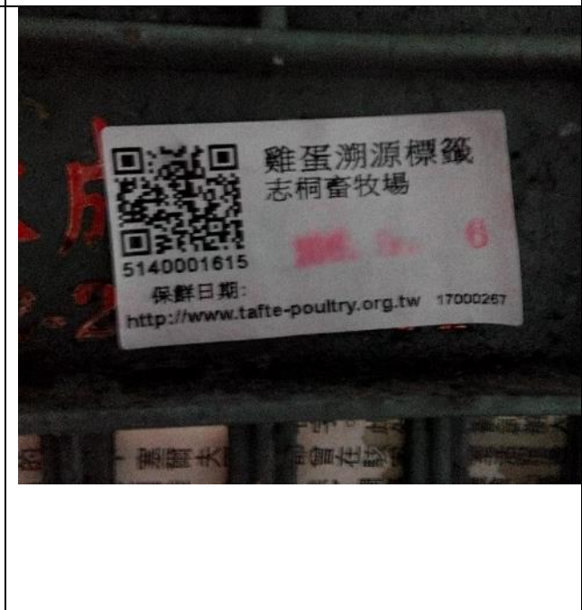
食材來源管理-肉品來源