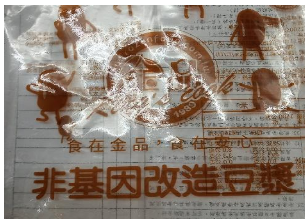
食材來源管理-非基改食品