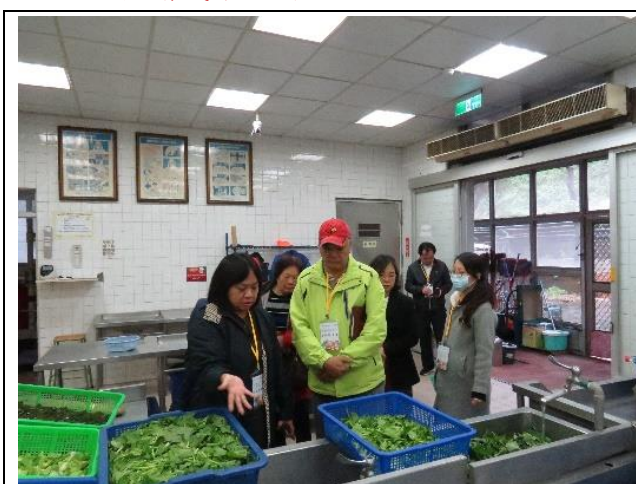
教育部每學年餐飲衛生實地輔導