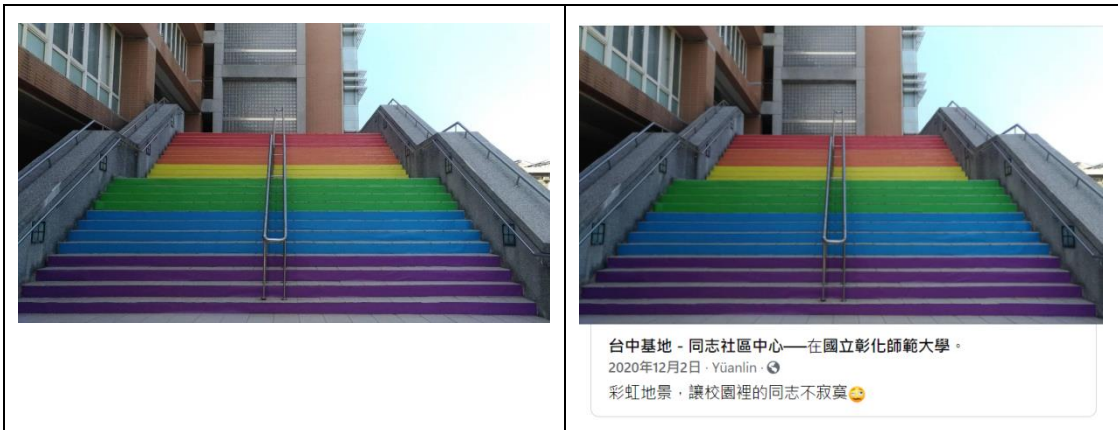
台中基地 - 同志社區中心——在國立彰化師範大學。 2020年12月2日 · Yüanlin · 📍 彩虹地景，讓校園裡的同志不寂寞 😊

▲2020年12月，本校性別平等教育委員會、性酷社、學生事務處、總務處於本校教學大樓前設置六色彩虹階梯地景，期使因性別、性別特質、性別認同或性傾向之不合理差別待遇而處於不利處境之學生感受到校園中溫暖、支持、認同及陪伴的力量。