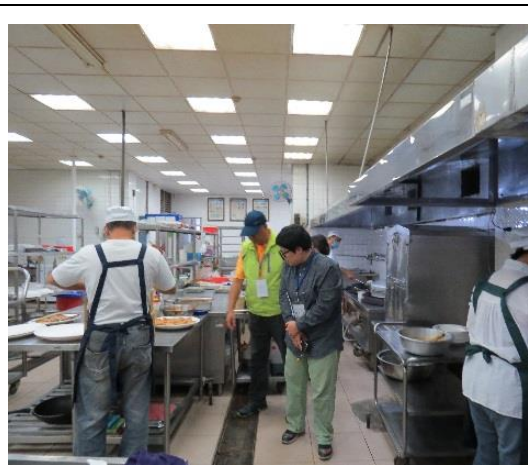
教育部進行餐飲衛生實地輔導