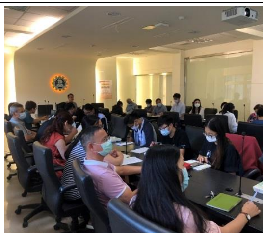
膳食管理委員會開會情形