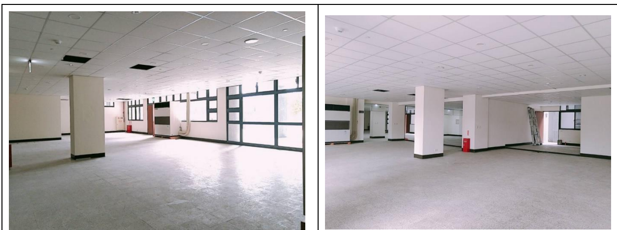
寶山校區美食街(預定場地)