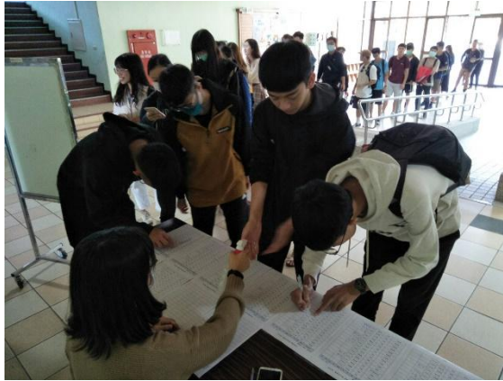
講座即將開始，學生陸續到場排隊簽到