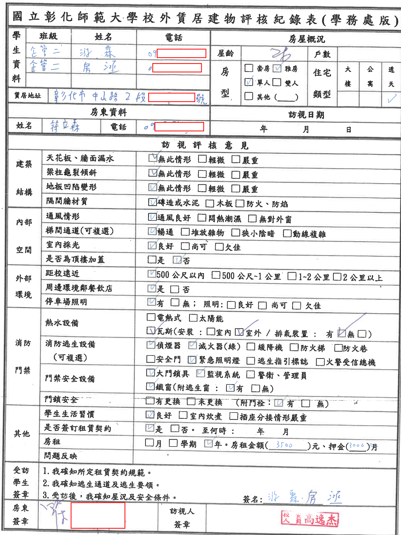
1-2. 住宿組抽樣安全訪查紀錄表(舉一例佐證)