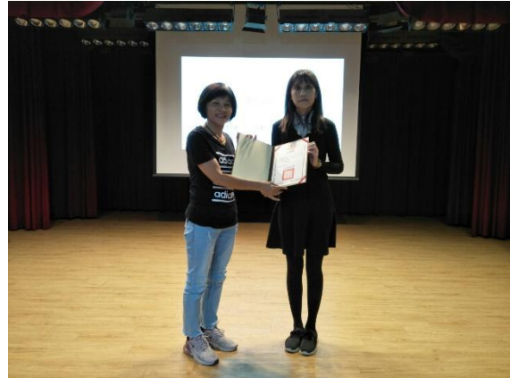
講座開始前先由住宿組游組長致贈感謝狀予講師