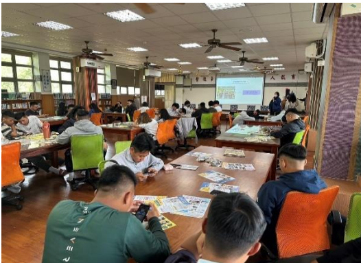
113年3月15日，至來義高中經驗分享