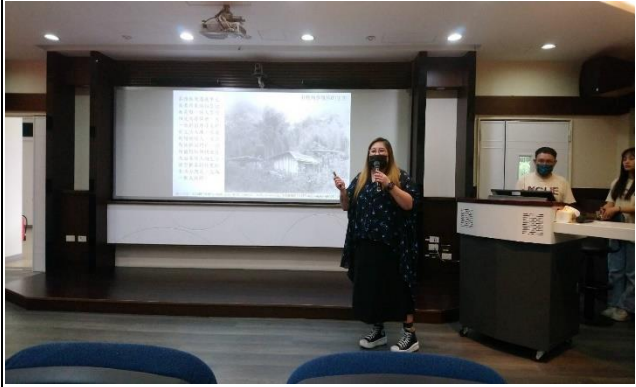
拉娃歐吉督導演講：在地青年如何與長者一起復振文化與照顧工作