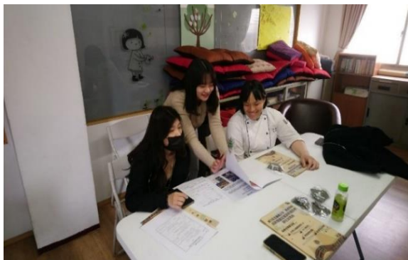
113年3月19日，至同德高中經驗分享