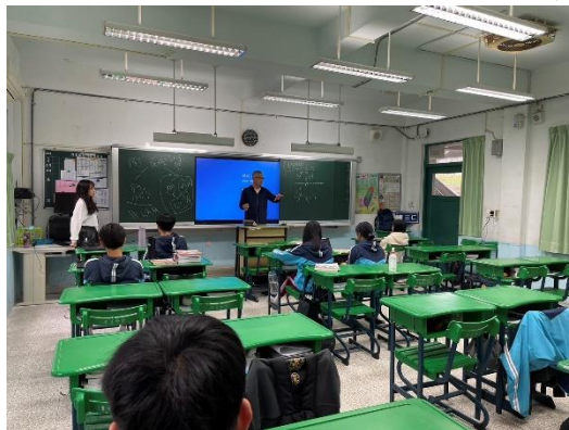
113年3月22日，至海星高中經驗分享