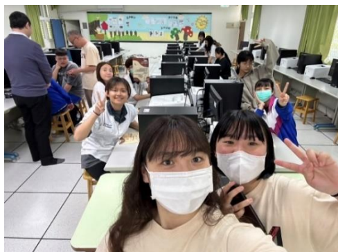
113年3月25日，至羅東家商經驗分享