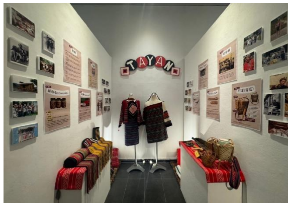
泰雅族文化介紹及生活藝品