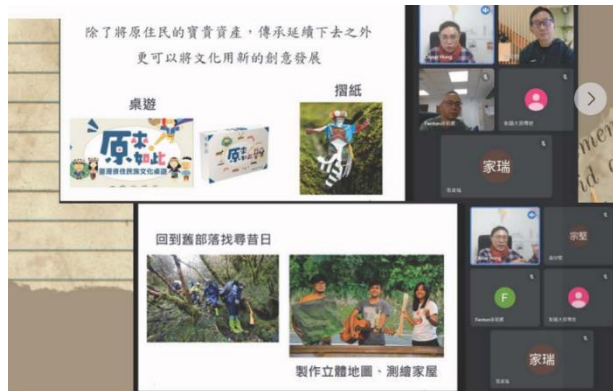
第三次教師社群活動：淺談原住民殖民歷史