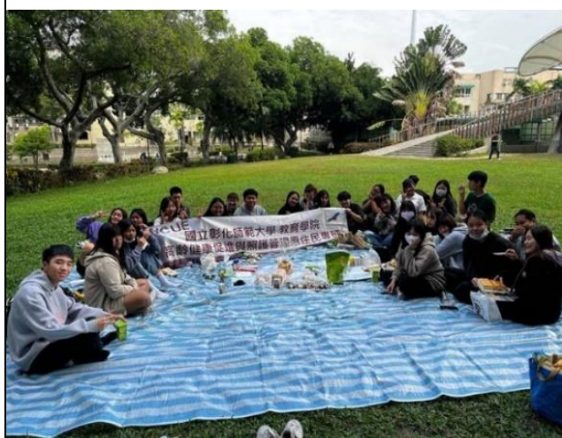
原住民族古調野餐會