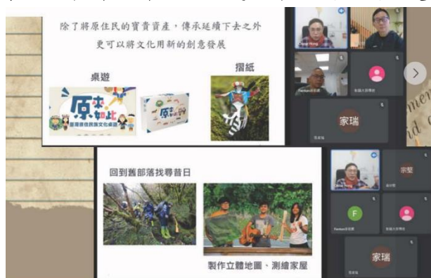
第三次教師社群活動：淺談原住民殖民歷史