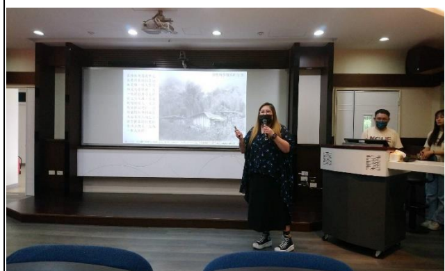
拉娃歐吉督導演講：在地青年如何與長者一 起復振文化與照顧工作