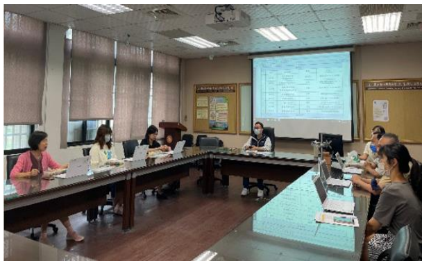
第一次教師社群活動：原住民族學生及專班相關規劃討論