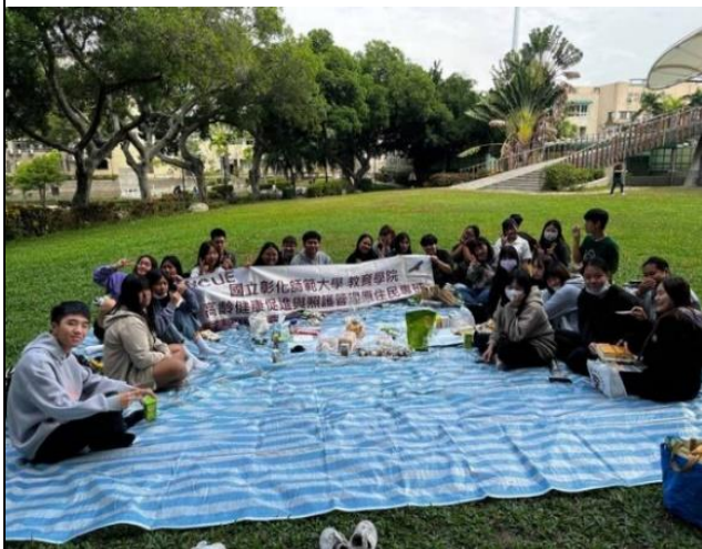
原住民族古調野餐會