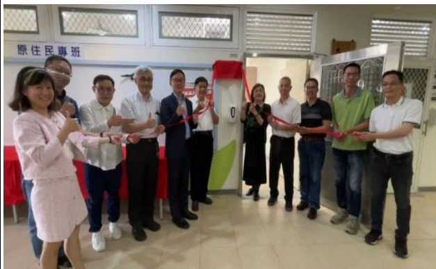
第二次教師社群活動：原住民專班成立茶會