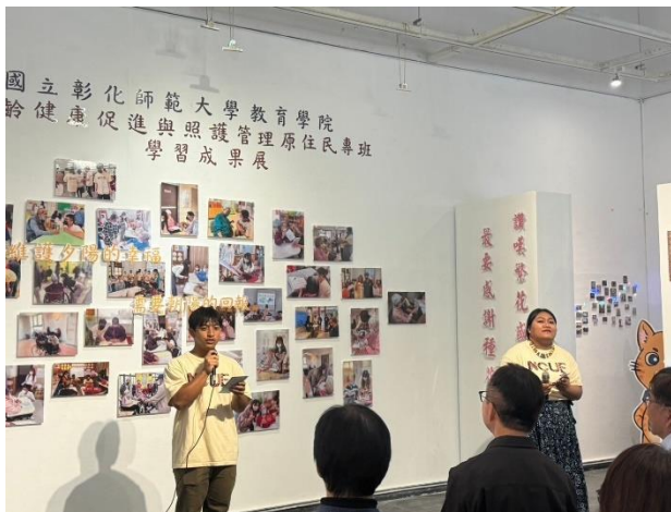
由原住民專班的兩位學生，主持開幕茶會