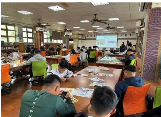
113年3月15日，至來義高中經驗分享