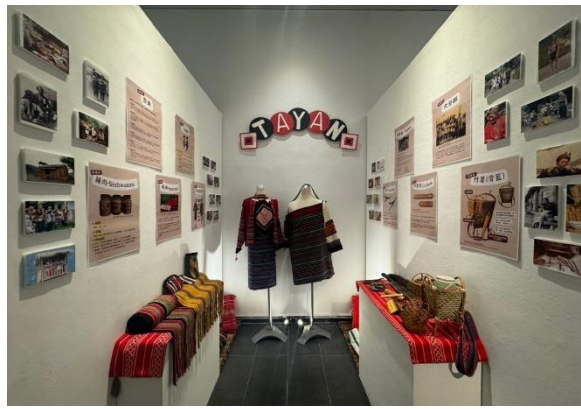
泰雅族文化介紹及生活藝品