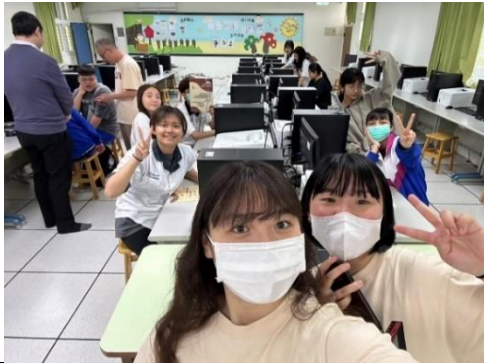
113年3月25日，至羅東家商經驗分享