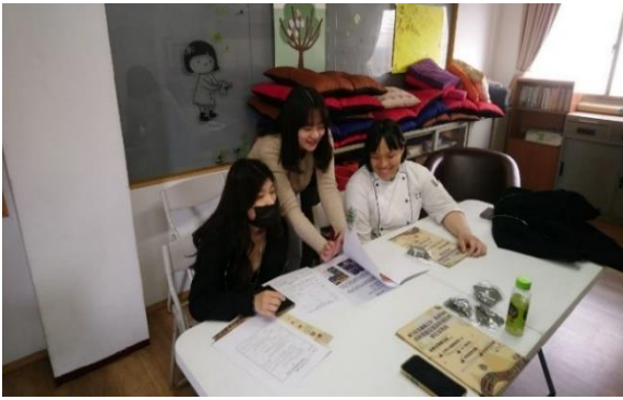
113年3月19日，至同德高中經驗分享