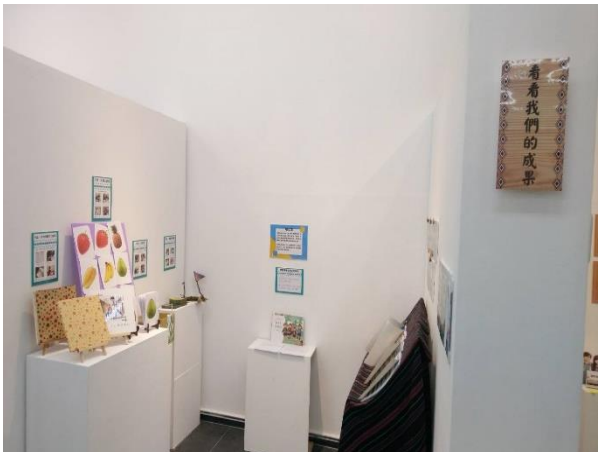
專班學生研發用於與高齡者互動的桌遊等