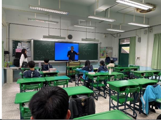
113年3月22日，至海星高中經驗分享