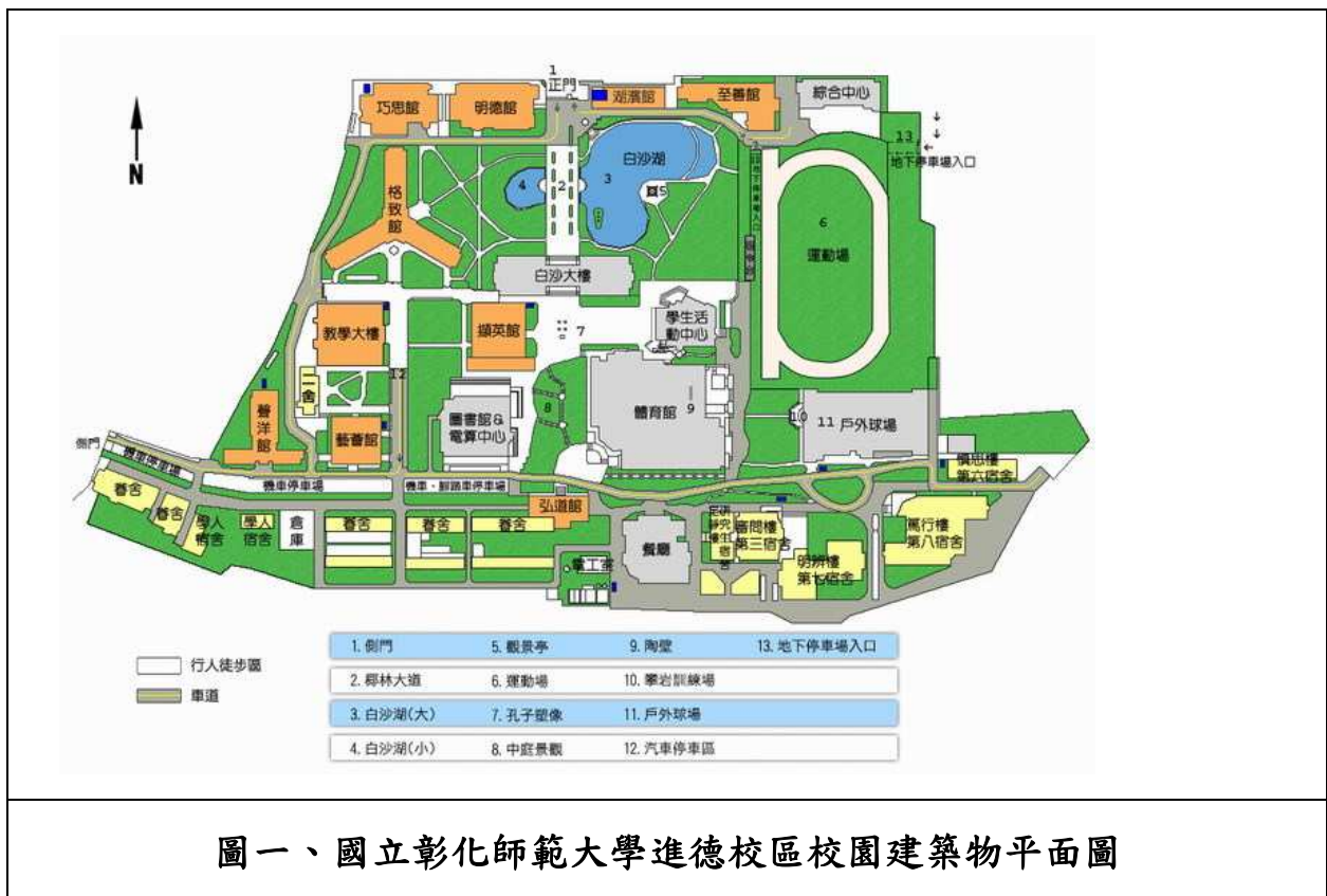
圖一、國立彰化師範大學進德校區校園建築物平面圖