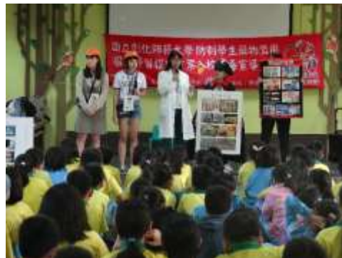
彰化縣媽厝國小反毒話劇宣導