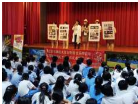
彰化市南國國小反毒話劇宣導(介 紹毒品)