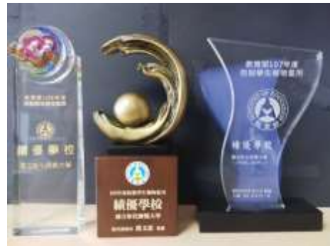
連續三年獲選全國大專校院防制 學生藥物濫用績優學校