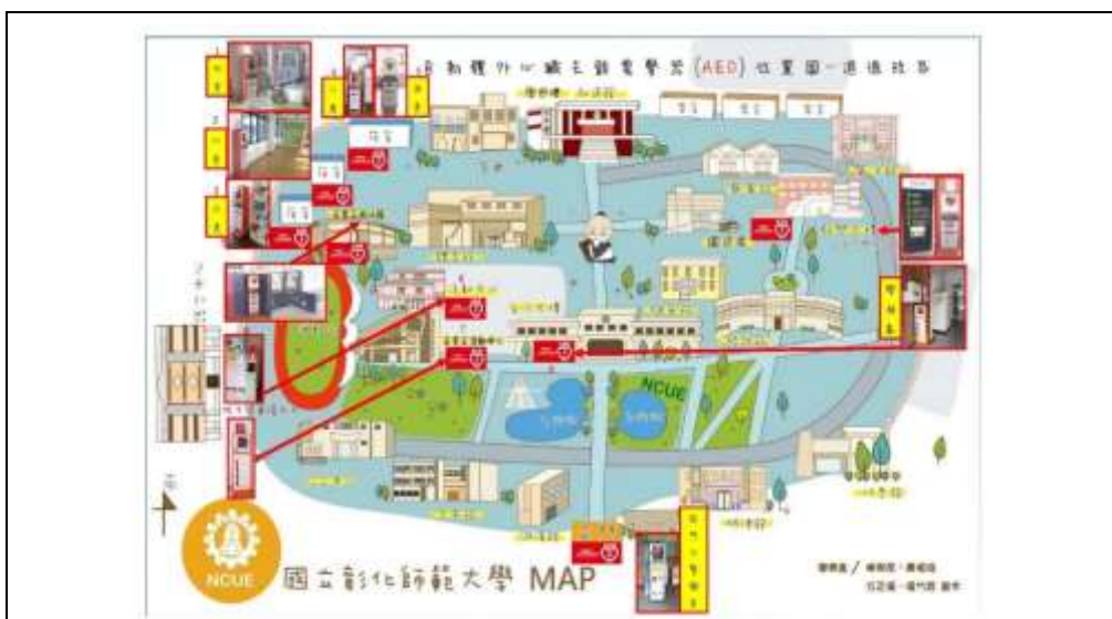
本校進德校區-AED 設置位置圖，共 10 台，提供緊急救護使用，營造安心校園氛圍