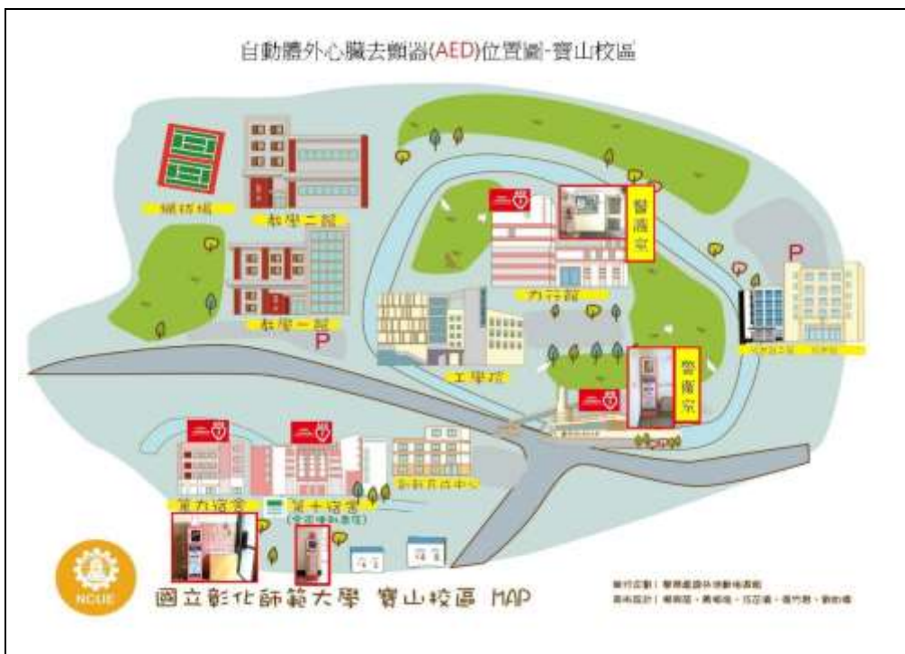
本校寶山校區-AED 設置位置圖，共 4 台，提供緊急救護使用，營造安心校園氛圍