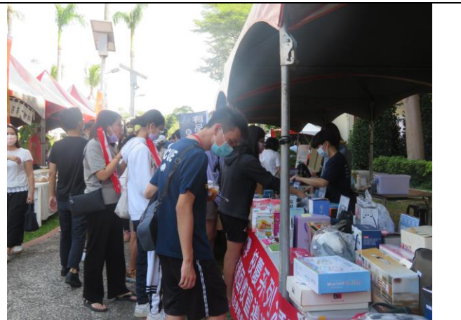
參觀選購人潮不斷