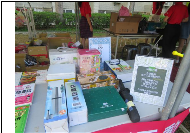
陳列擺設捐贈品供大家參觀選購