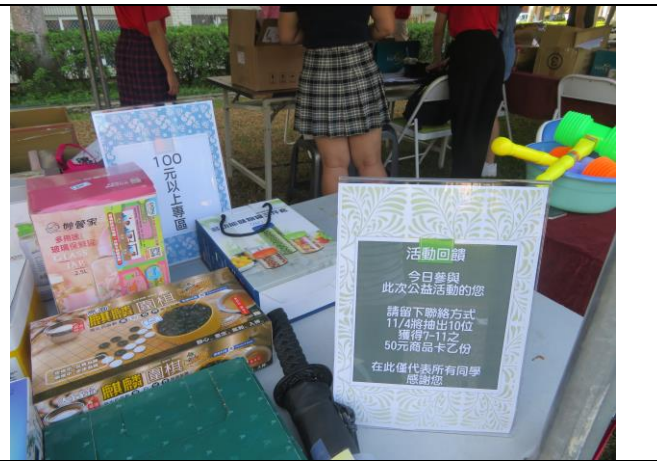
陳列擺設捐贈品供大家參觀選購