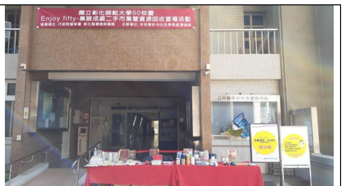
本校50校慶 Enjoy fifty-集腋成裘二手市集暨資源回收宣導活動開市