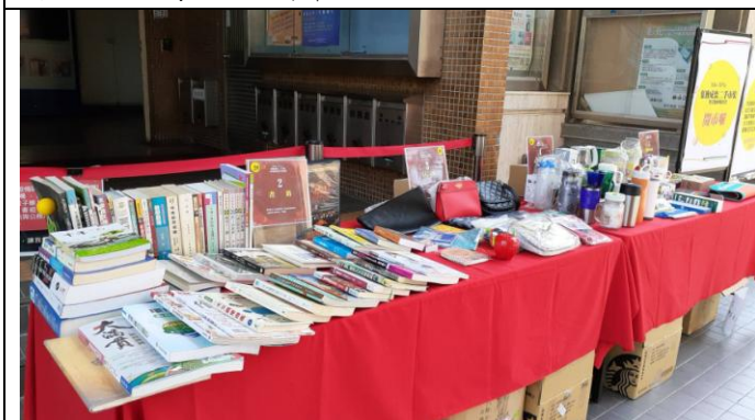
陳列擺設捐贈品供大家參觀選購