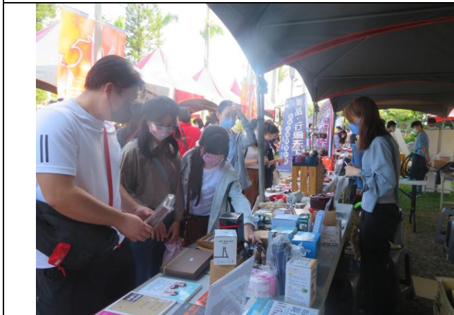
參觀選購人潮不斷