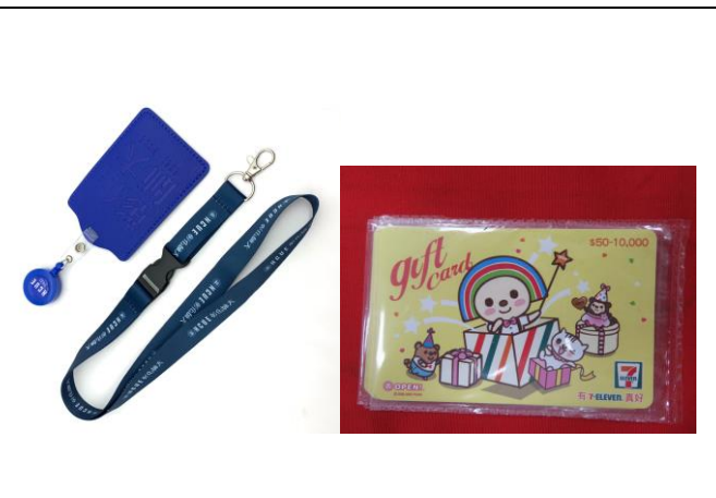
捐贈者及購買者抽獎獎品