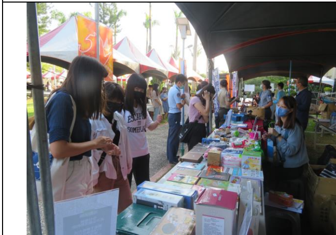
參觀選購人潮不斷