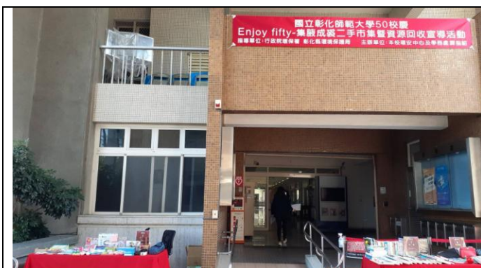
本校50校慶 Enjoy fifty-集腋成裘二手市集暨資源回收宣導活動開市