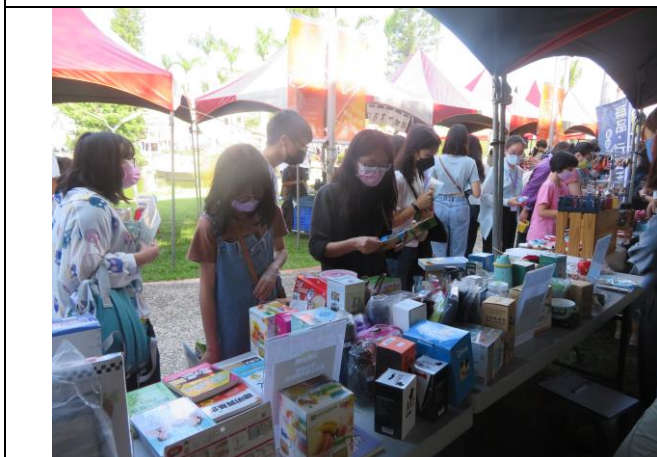
參觀選購人潮不斷