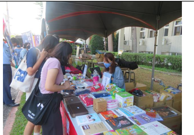
參觀選購人潮不斷