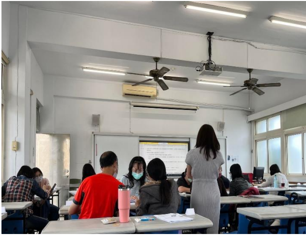
圖說：社會技巧課程一分組討論教學現場學生行為樣態