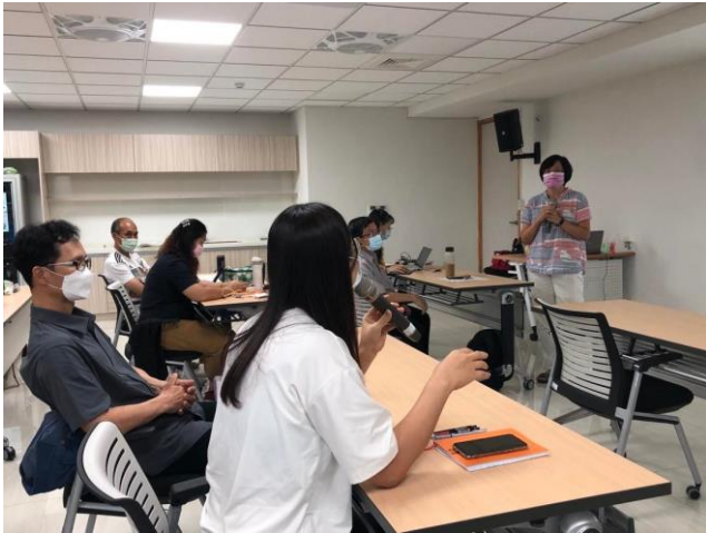
圖說：特殊教育課程運作實務課程：學員分享在教學現場遭遇困難與作法討論