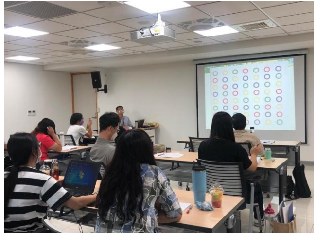
圖說：學習策略課程：以圖示具體說明學習障礙學生學習困難之樣態與反應